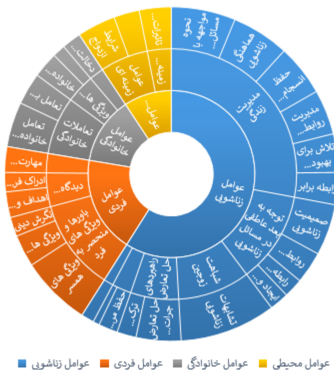
شکل ۲: عوامل مرتبط با رضایت زناشویی شناسایی شده از مطالعات کیفی گذشته