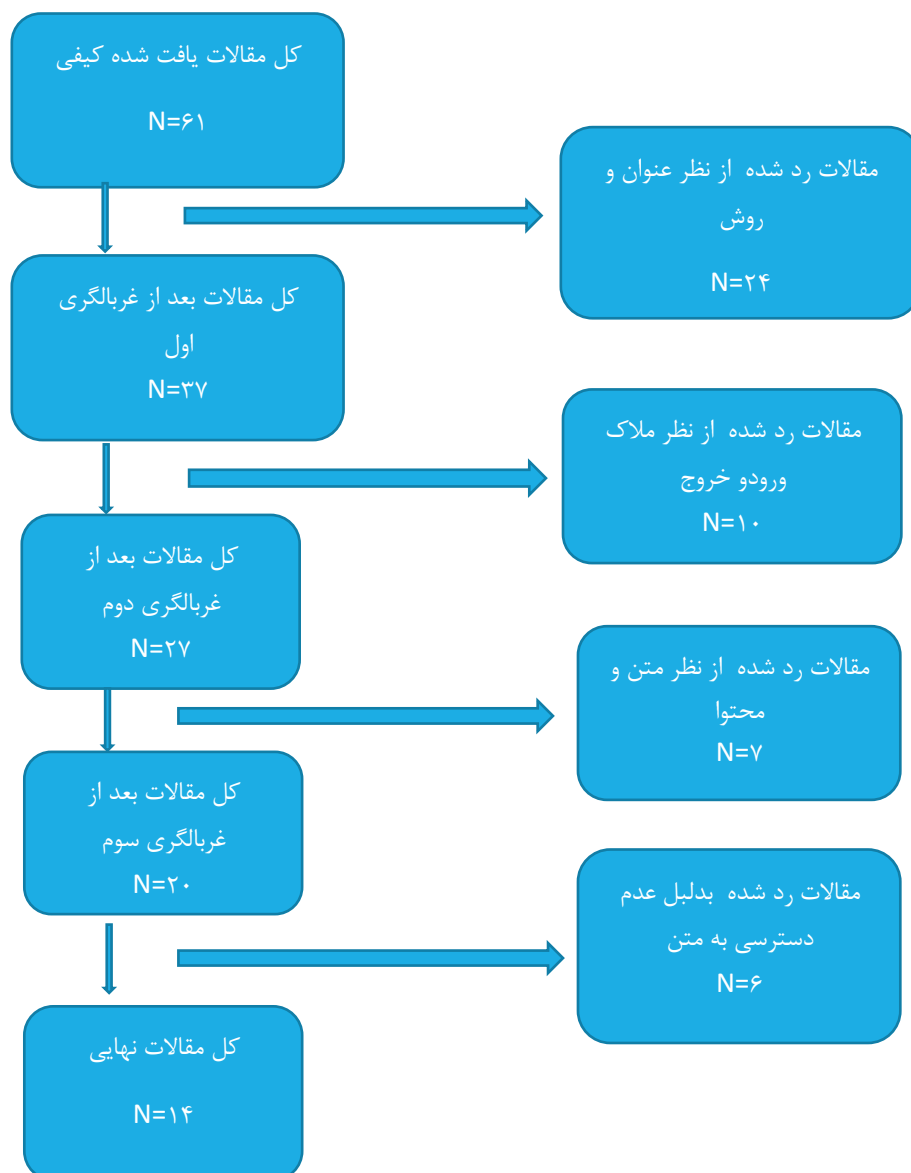
شکل ۱ چگونگی انتخاب مقالات و مراحل آن

از طرفی طبق مرحله سوم ساندلوفسکی و باروسو (Sandelowski & Barroso, 2002) جهت جستجو و انتخاب متون مناسب و برای ارزیابی کیفیت مطالعه‌های اولیه پژوهش‌های کیفی از برنامه مهارت‌های ارزیابی حیاتی ۱ (CASP) استفاده شد. این ابزار به محقق کمک می‌کند تا دقت، اعتبار و اهمیت مطالعه‌های کیفی را مشخص سازد. در این برنامه هر مقاله بر اساس ده معیار (هدف تحقیق، منطق روش، طرح تحقیق، روش نمونه‌برداری، جمع‌آوری داده‌ها، رابطه پژوهشگر و شرکت‌کننده، ملاحظات اخلاقی، دقت تجزیه و تحلیل داده‌ها، بیان واضح یافته‌ها، ارزش پژوهش) ارزیابی می‌شوند. بر اساس مقیاس ۵۰ امتیازی روبریک، هر مقاله‌ای که امتیازش کمتر از ۳۰ باشد حذف می‌گردد. امتیاز بندی به این صورت است: ۰ تا ۱۰ ضعیف، ۱۱ تا ۲۰ متوسط، ۲۱ تا ۳۰ خوب، ۳۱ تا ۴۰ خیلی خوب و ۴۱ تا ۵۰ عالی؛ در این پژوهش از بین ۶۱ مقاله انتخابی تعداد ۱۴ مورد انتخاب شد.